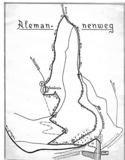
Handgezeichnete Wanderroute 1984

Sein wohl bleibendstes Denkmal im Schwarzwaldverein Zell setzte er mit der Initiierung des „Wiesentäler Alemannenwegs“, der bis heute vom Schwanenweiher hinauf zum Äußeren Schänzli führt. Dieses Projekt zeigt beispielhaft, wie er seine Liebe zur alemannischen Sprache mit der aktiven Landschaftspflege verknüpfte. Anlässlich des damaligen Vereinsjubiläums entstand 1984 auf seine Initiative hin dieser besondere Rundwanderweg.